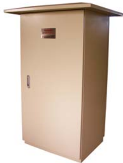
图 4: 密闭采样系统柜

图 4 所示密闭采样系统柜是一种特制的多晶硅氯硅烷取样柜, 它具有安全可靠、取样方便, 易操作和维护简单等特性。