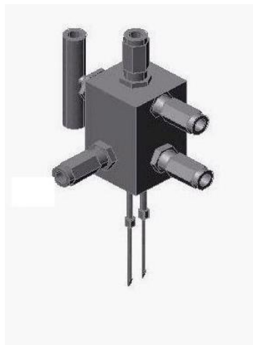
附图 2: 手动的针刺取样阀

本密闭取样系统采用了一个手动的针刺取样阀作为连续取样器。该针刺式取样阀是一个阀芯能转动 90° 的组合阀，阀芯有一个特制的导向孔。这个取样阀是一种专门设计并定做的连续取样器，它可以在取样过程中允许样品连续流动。