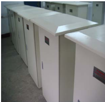
附图 1: M-MHMC 较低温度液体密闭取样系统

本密闭取样系统采用了一个手动的针刺取样阀作为连续取样器。该针刺式取样阀是一个阀芯能转动 90° 的组合阀，阀芯有一个特制的导向孔。这个取样阀是一种专门设计并定做的连续取样器，它可以在取样过程中允许样品连续流动。